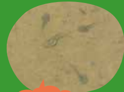
オタマジャクシはしっぽがあるね

何でだろう。分からないなあ。でも、子どもの頃のオタマジャクシにはちゃんとしっぽがあるね。大きくなるとしっぽがなくなってしまうんだ。カエルが人気者なのは、人間と同じでしっぽがないからかもしれないね。