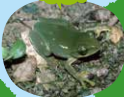
シュレーゲルアオガエル

ジャンプ力のあるカエルは水そうにぶつかってケガをすることがあるから注意かな。先生が飼っているのは、動きの鈍いヒキガエル、吸盤を持っているアマガエルやシュレーゲルアオガエルだよ。ヒキガエルは8年も飼っているし、アマガエルやシュレーゲルも3年くらい飼っているんだ。エサを食べてくれたら飼育しても大丈夫。食べてくれなかったら逃がそうね。