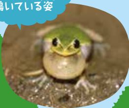
アマガエルの鳴いている姿

カエルは一年中鳴いているわけじゃないよ。鳴く季節が決まっています。繁殖期という卵を産む季節だけだよ。この時期にはオスとメスが出会うことが必要なんだ。オスとメスが出会えるように、「ここにいるよ」と誘うように鳴くんだ。カエルの世界では、声を出せるのはオスだけ、メスは鳴き声が出せないんだよ。