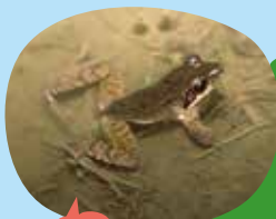
つしま こゆうしゆ ツシマアカガエル

いるよ。対馬という島の名前をきいたことがあるかな。この島には、ツシマアカガエルというこの島にしかないカエルがいるよ。赤茶色の小さなカエルだよ。地球上で長崎県だけ(対馬だけ)にいるめずらしいカエル。だから、もし、何かの原因で対馬からいなくなったら、地球上のカエルが一種類減ったことになるんだよ。大事にしていきたいね。※その場所にしかない種類を固有種といいます。