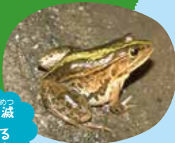
ながさきし ぜつめつ 長崎市では絶滅したと思われるトノサマガエル

住む場所を変えることができないカエルたちは住んでいた環境が変わると生きていけなくなります。たんぼで生活していたトノサマガエルはたんぼの環境が変わると共に減ってしまったんだ。