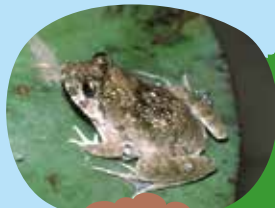
たんぼが大好きなヌマガエル

長崎市には10種類だよ。長崎県には13種類、日本全体では50種くらいかな。地球上では7500種くらいになるし、今でも新種がどんどん見つかるよ。